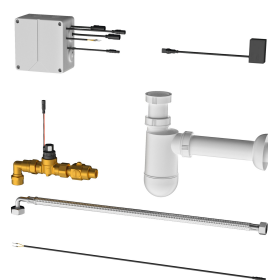
Siphon à déclenchement électronique