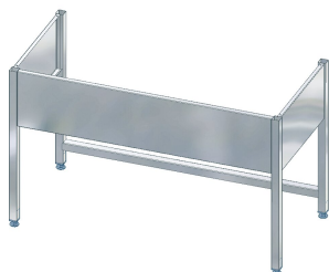
MAXIMA Podstawa do Maxima