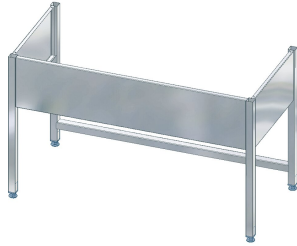
MAXIMA Untergestell zu Maxima