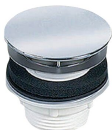
Bonde de vidage à dôme