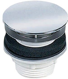
Piletta di scarico pop-up