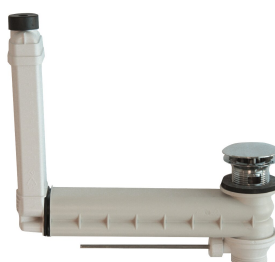
Excentrická odtoková a přeřadovací sada