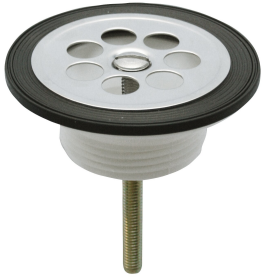
Desagüe con colador