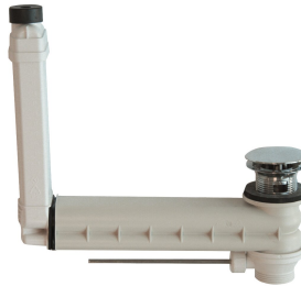
Piezas de montaje para instalación de desagüe y rebosadero