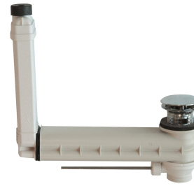
Ab- und Überlaufgarnitur