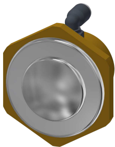
Zawór do armatury spłukującej