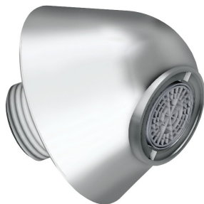
Wylewka ścienna DN 15