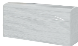
Salviette asciugamani piegate