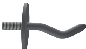
Gancho para colgar