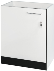
Unterbauschrank, Türanschlag links