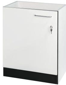
Unterbauschrank, Türanschlag rechts