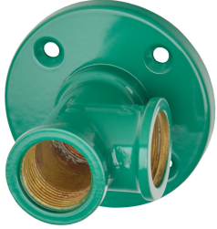
Seinäläpivienti ja kannake hätäsuihkulle