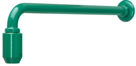
Notduschkopf mit Wandarm