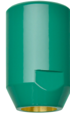
Pomme de douche d'urgence