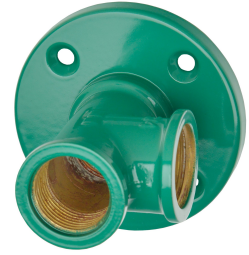
Nooddouchekop met douchearm