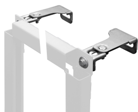
Set supports muraux AQUAFIX

Modell-Linie: AQUAFIX | CMPX151 Unités d'installation | Bâti-support pour lavabo