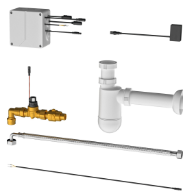
Elektronische Siphonsteuerung für KWC Reihenurinale