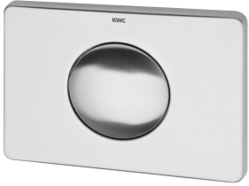
Bedieningsplaat met enkele spoelmogelijkheid

Modell-Linie: AQUAFIX | AQFX0006 Installatie-elementen | Installatie-elementen voor toiletten