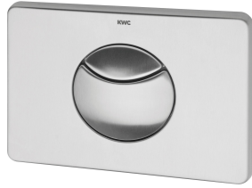
Bedieningsplaat met dubbele spoelmogelijkheid