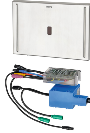
EXOS. WC-sturing spoelreservoir