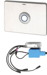
AQUATIMER - A3000 open elektronische WC-sturing