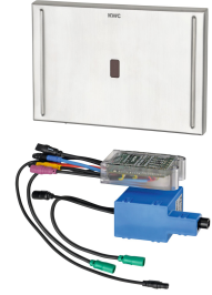
Control de cisternas para inodoros EXOS.