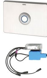
Control electrónico para inodoro AQUATIMER - A3000 open