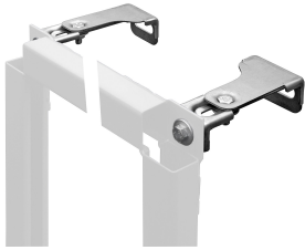
Staffe a parete AQUAFIX