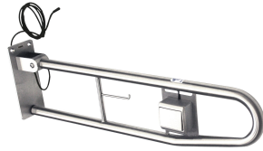
Maniglione ribaltabile CONTINA, con pulsante di scarico