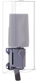
EXOS. Konverteringssats för skumtvåldispenser