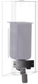
EXOS. Konverteringssats för tvåldispenser för flytande tvål