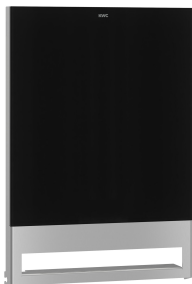
EXOS. Front mit schwarzem ESG-Glas