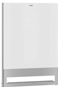
Pannello frontale con vetro ESG bianco EXOS.