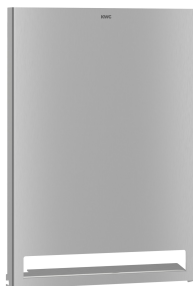
EXOS. Front ze stali chromowo-niklowej