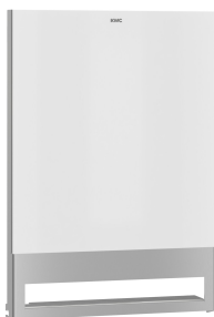
EXOS. Front z białym szkłem ESG