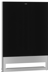
EXOS. Front mit schwarzem ESG-Glas