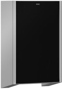
Capot frontal avec verre trempé noir EXOS.