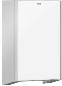
Capot frontal avec verre trempé blanc EXOS.