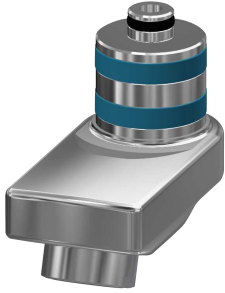
Zwenkuitloop, 40 mm