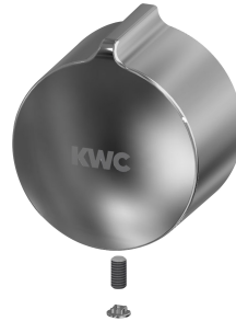
Drukdrop van handvat