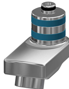
Zwenkuitloop, 40 mm