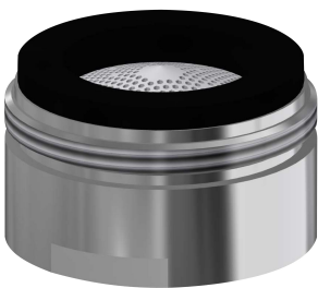
Mousseur à jet laminaire