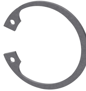
Bague de sécurité