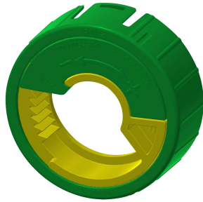
Butée de température