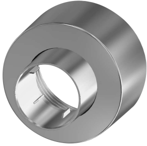
Rosette à vis