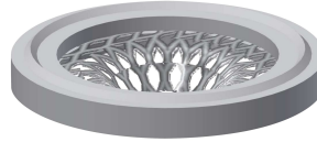
Strainer seal 24 x 17 x 2.5 mm