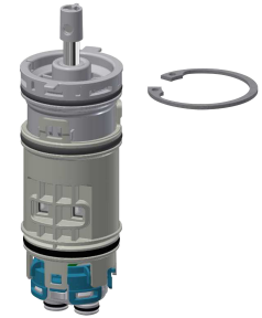
Cartuccia di miscelazione temporizzata FRAMIC