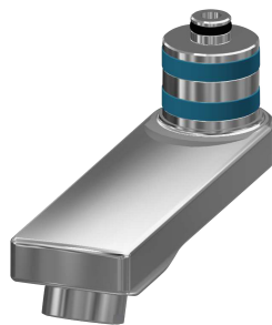
Bocca orientabile, 100 mm