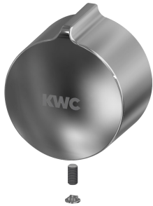
Cappuccio a pressione della manopola