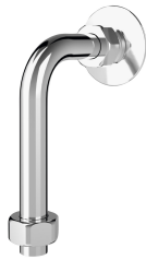
Connessione curva alla mandata del soffione