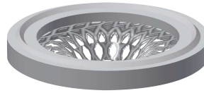
Strainer seal 24 x 17 x 2.5 mm