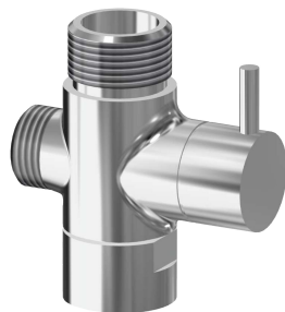
Deviatore per docce