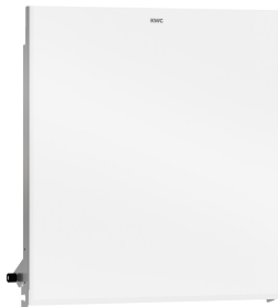
EXOS. Front z białym szkłem ESG