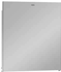
EXOS. Front ze stali chromowo-niklowej

Akcesoria łazienkowe | Podajniki ręczników papierowych