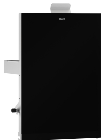
Pannello frontale con vetro ESG nero EXOS.

Modell-Linie: EXOS | EXOS611EX Accessori | Ricettacoli per rifiuti igienici