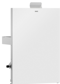
Pannello frontale con vetro ESG bianco EXOS.