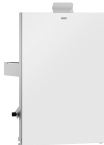
Parte frontal con cristal ESG blanco EXOS.