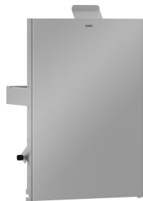
Parte frontal de acero de cromo-níquel EXOS.

Accesorios | Papelera para envases de higiene