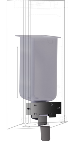
Kit de conversión para dispensador de jabón líquido EXOS.