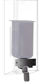
Kit de transformation pour distributeur de savon liquide EXOS.