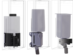
Kit de transformation EXOS.