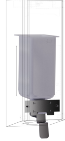
EXOS. Konverteringssats för tvåldispenser för flytande tvål