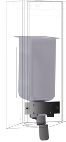
EXOS. Umrüstkit für Flüssigseifenspender