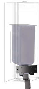
Kit di conversione per distributore di sapone liquido EXOS.