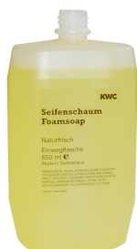
Cartuccia di sapone in schiuma