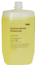
Foam soap cartridge