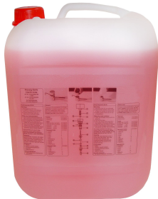
Mydło w płynie