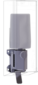
EXOS. Zestaw do modyfikacji dozownika mydła w piance