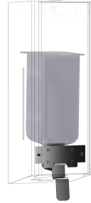
EXOS. ombouwset voor vloeibare- zeepdispenser