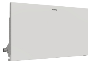
EXOS. front met zwart veiligheidsglas