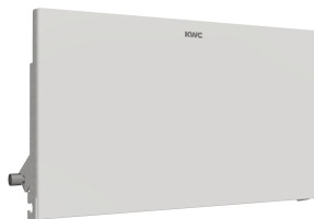
Pannello frontale con vetro ESG bianco EXOS.