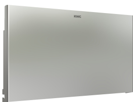
Pannello frontale in acciaio inox EXOS.

Accessori | Portarotoli di carta igienica