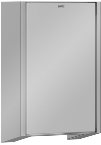
EXOS. Frontabdeckungen für EXOS. Händetrockner