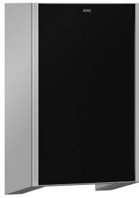
EXOS. Frontabdeckung mit schwarzem ESG-Glas