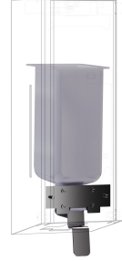
Kit di conversione per distributore di sapone liquido EXOS.