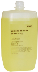
Cartuccia di sapone in schiuma