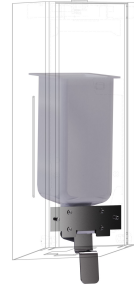
EXOS. Zestaw do modyfikacji dozownika mydła w płynie