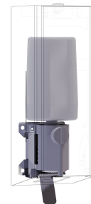
Kit di conversione per distributore di sapone in schiuma EXOS.