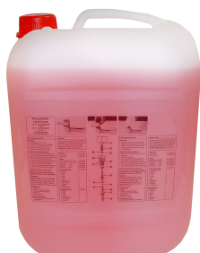
Mydło w płynie